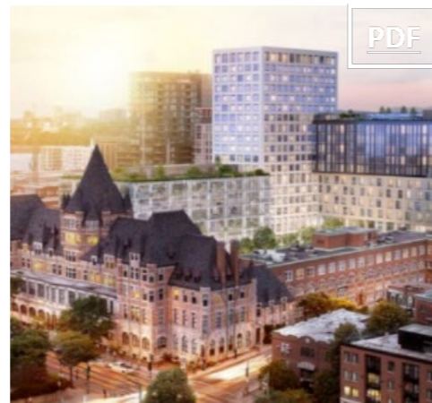
Place Gare Viger 田 860 – 3,759 pc