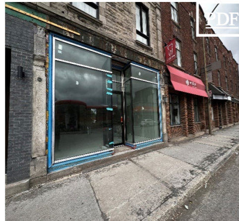
1539 Notre-Dame Ouest 田 1,272 pc + 1,200 pc