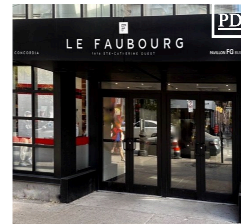
1616 Ste-Catherine O. 5 kiosques