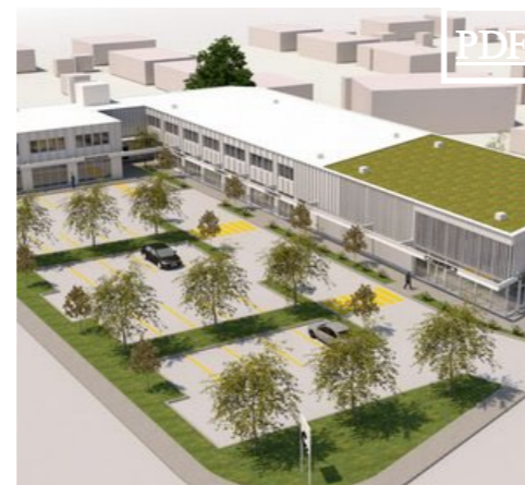
1871 St. Louis 田 772 pc to 4,125 pc