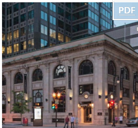
777 Ste-Catherine O. ⊞ 26,463 pc