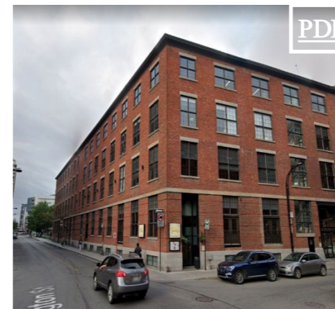
645 Wellington 田 5,996 pc