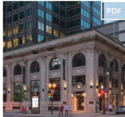
777 Ste-Catherine Ouest 26,463 pc