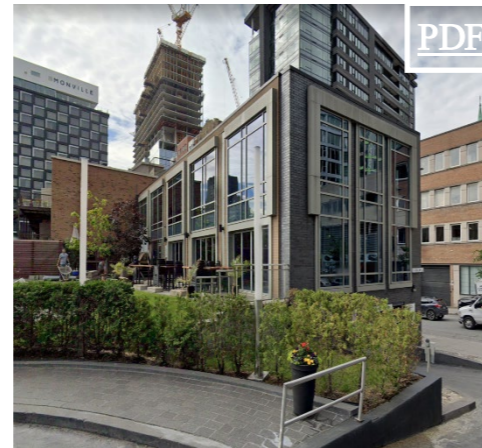
1101 de Bleury 2,860 pc