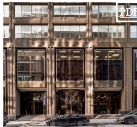
1010 Sherbrooke Ouest 1,665 pc