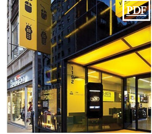
1192 Ste-Catherine O. 6,800 pc