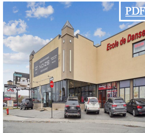
7335 Décarie – 5255 Namur 田 13,362 pc 田 6,827 pc