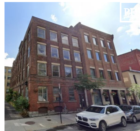
754 St-Paul Ouest 田 1,158 pc & 3,939 pc