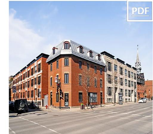
1351 René-Lévesque E ⊞ 1,200 pc-1,300pc