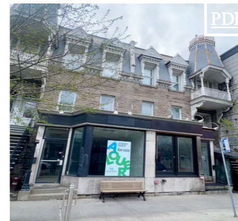
4067 St-Denis 田 1,560 pc