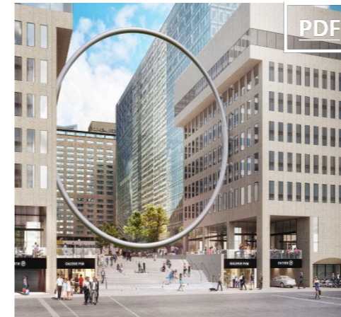
Galerie PVM 793 – 13,984 pc