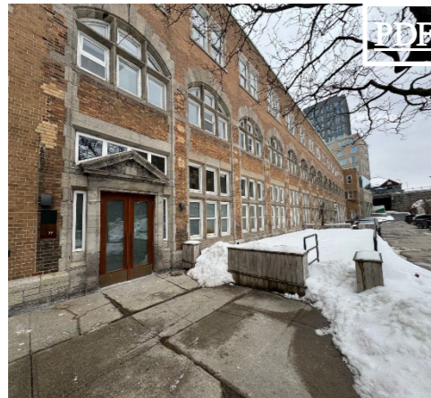
775 Berri 田 3,661 pc & 1,522 pc