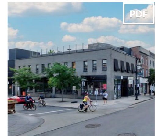
3781-3785 St. Laurent 田 Jusqu'à 5,025 pc