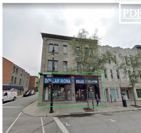
1846 Ste. Catherine E. ⊞ 4,000 pc + 1,500 pc