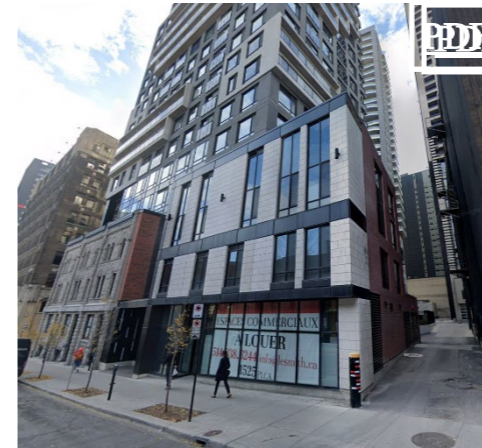
2120 de Bleury 1,525 pc