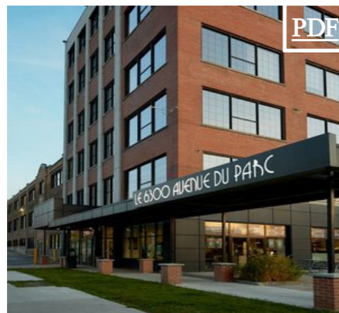
6300 Parc 田 1,227 pc + 3,239pc