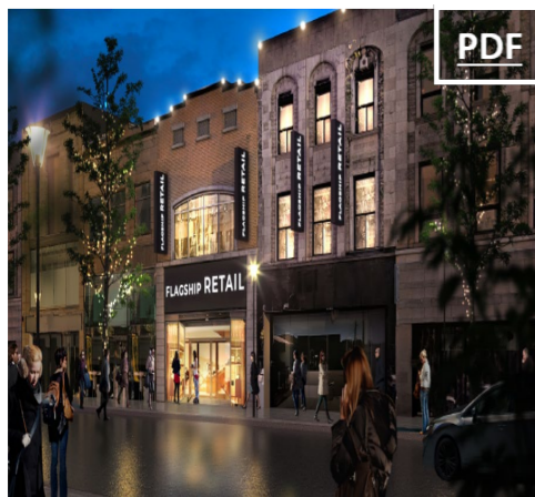
966 Ste-Catherine Ouest 8,366 pc