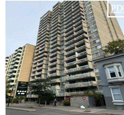
2100 De Maisonneuve. ⊞ 3,200 pc