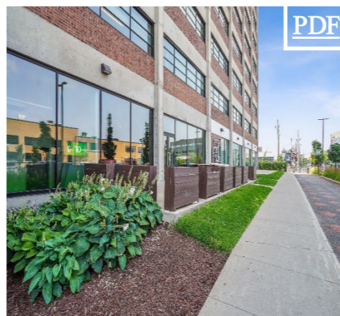
7250 Mile-End, Suite 100 田 2,210 pc