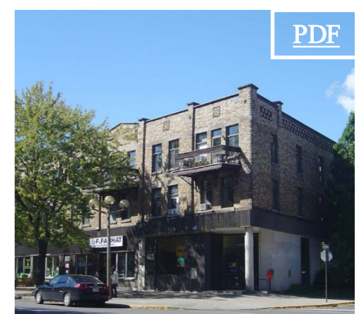
5651 Sherbrooke Ouest 田 4,148 pc