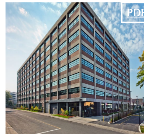
7250 Mile End 田 3,762 pc