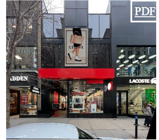
1015 Ste-Catherine O. 7,500 pc