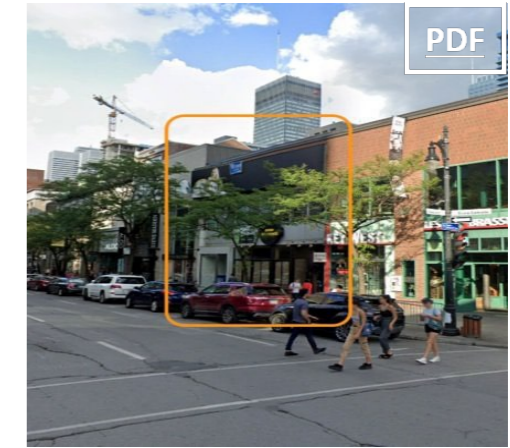
1348 Ste-Catherine Ouest 6,294 sf (3,147 sf per floor)