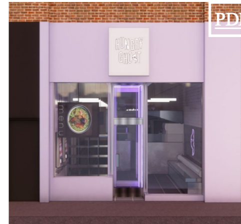
1429 rue Atateken