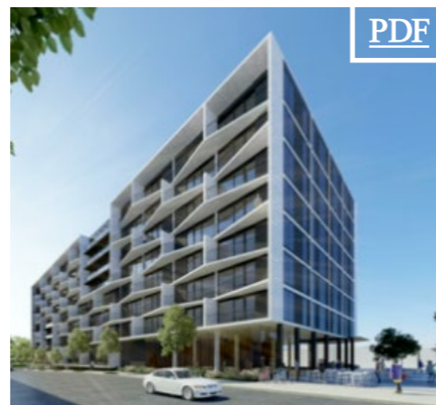
6585 Ave. Durocher 田 1,325 pc