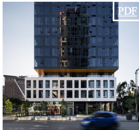
Clark / Maisonneuve O. ⊞ 4,360 pc & 2,991 pc