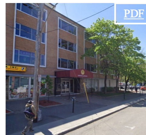
3600 Barclay 田 4,937 pc & 700 pc & 800 pc & 2,803 pc