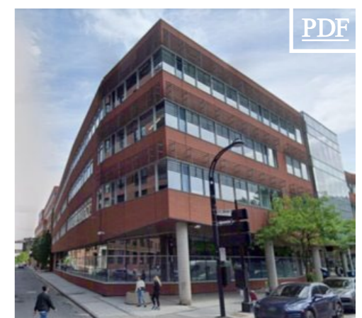
700 Wellington 田 10,827 pc